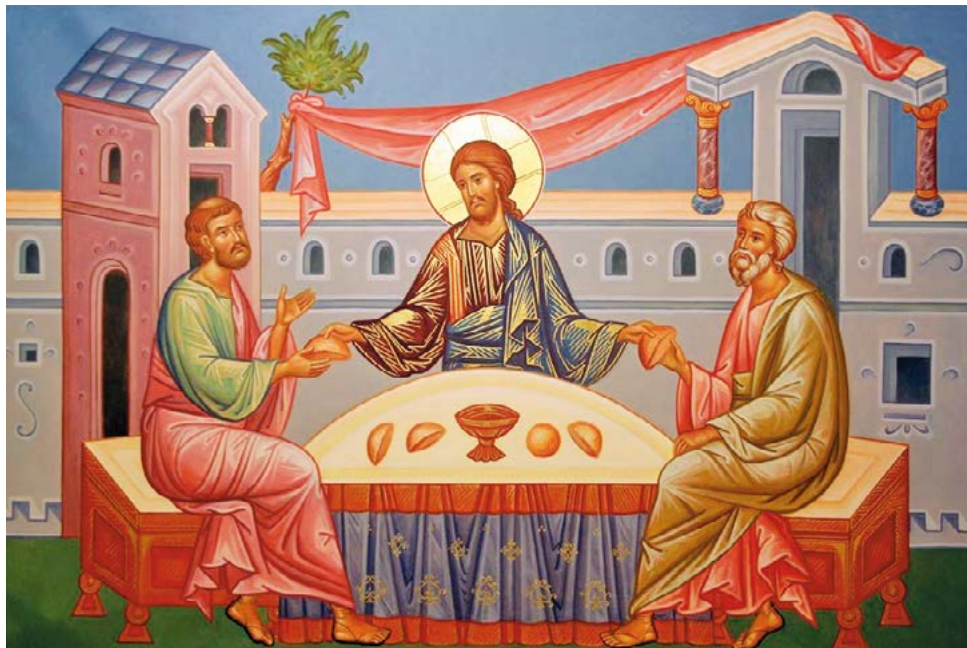
Icona dels deixebles d'Emmaús

En l'escena distingim dos camins, que fan els deixebles. Un és el que pot representar la vida «normal», és a dir, el camí que anem fent portats pels sentiments i impulsos «naturals», segons vivències que ens ofereix la vida. És un camí de recerca, més o menys conscient, de benestar o de serenitat. Si aquesta ha estat amenaçada, cal trobar respostes. En el cas dels deixebles d'Emmaús, caminen des de la profunda decepció que va produir en ells la mort (el fracàs) de Jesús: sor-